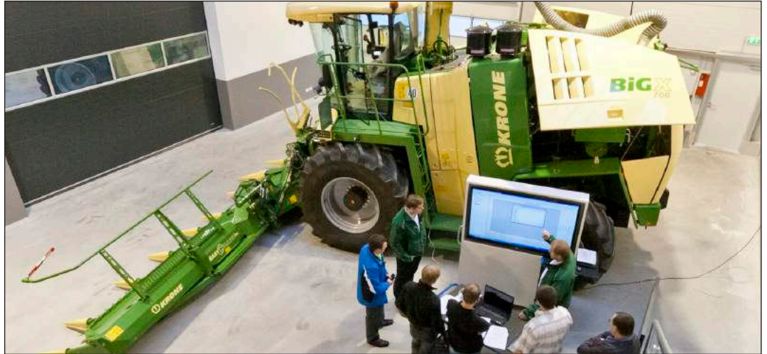
▲ Computergestützte Lernerfahrung im KRONE Training Center.